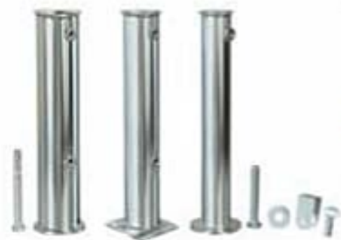
T45-T55-T65 Pocinčana tuba. Uključeni vijci