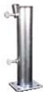
T55-T65 Pocinčana tuba za fiksiranje u tlo. Može se kombinirati s BTC