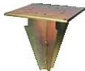
BTB Postolje za fiksiranje u tlo. Za bočne suncobrane.